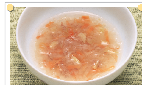
牛肉と野菜のスープ

〈材料〉牛もも肉1/2・玉ねぎ20g・大根20g・にんじん1/8・セロリ1/4・だし汁大さじ5杯・塩少々