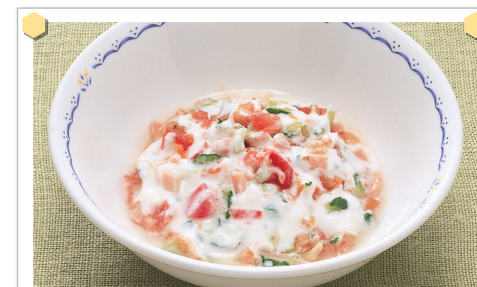
サラダのヨーグルトあえ

〈材料〉きゅうり1/4・にんじん1/4・ハム1枚・トマト1/2・プレーンヨーグルト大さじ4杯