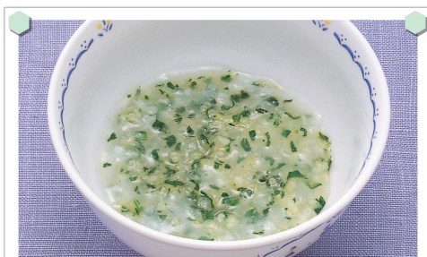
ほうれん草のおかゆ