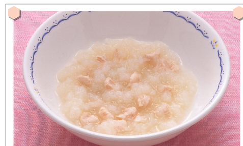
鶏肉のかぶのおろし煮