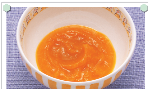
カボチャのペースト