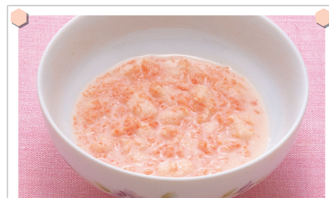
にんじんのパンがゆ