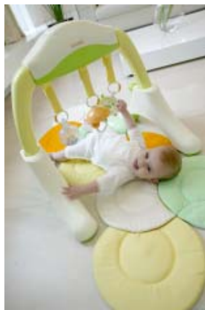
プレイジム使用時