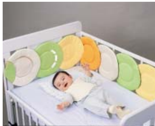
ベッドガード使用時