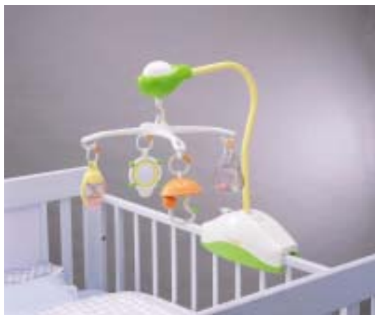
メロディメリー使用時