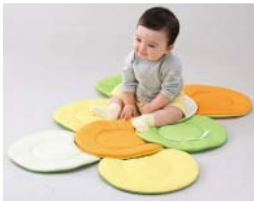
プレイマット使用時