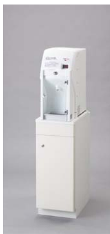
CH22-1/2 シンク併設用・単独タイプ