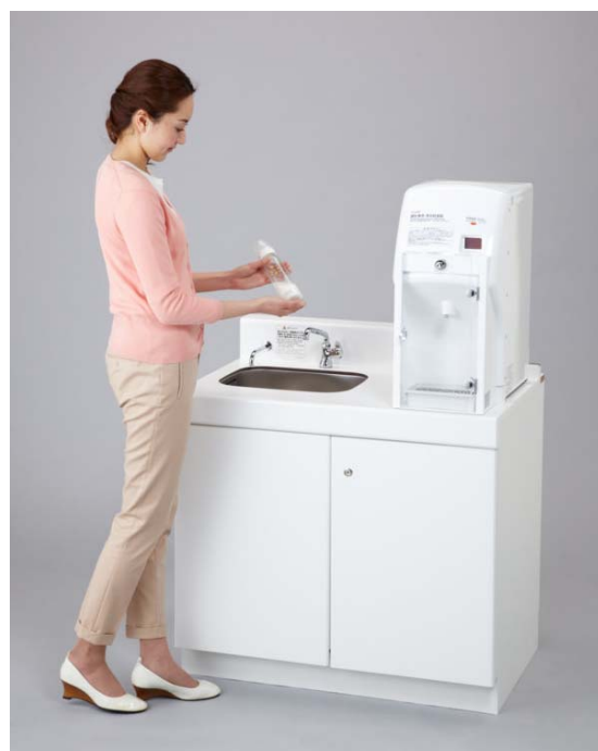
CH22-3 シンク一体タイプ

※70℃以上のガイドライン：『乳児用調製粉乳の安全な調乳、保存及び取扱いに関するガイドライン』（2007年6月 厚生労働省告示）