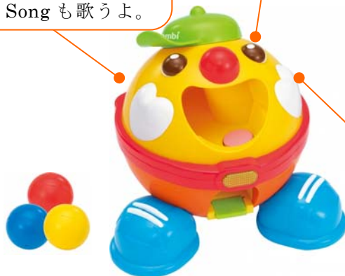
英語でおしゃべりちょうだいなくん