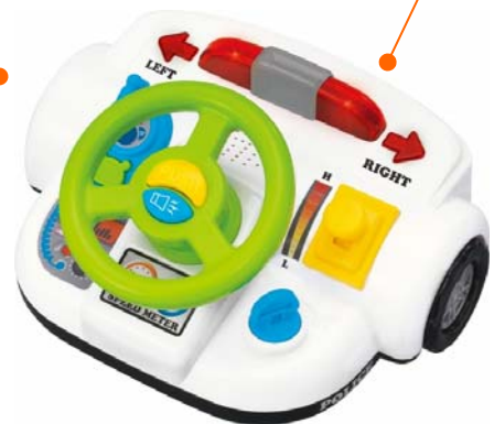
英語でナビゲートパトカー