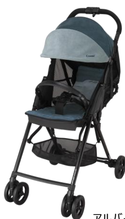
アルバーノネイビー(NB)