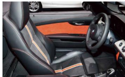
BMW Z4 ロードスター Sdrive35is