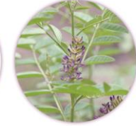
カンゾウ根エキス

さまざまな肌荒れの要因にアプローチするスキンケア成分を厳選配合。刺激によるヒリつきやかゆみを抑え、すこやかなお肌へと導きます。