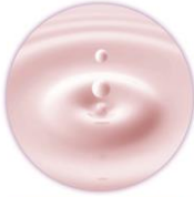
加水分解コラーゲン