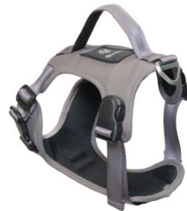
チャコールグレー(CG)