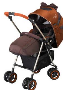
ディアクラッセ オート4 キャス エッグショック