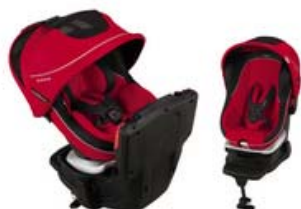
ラクティアターン エッグショック