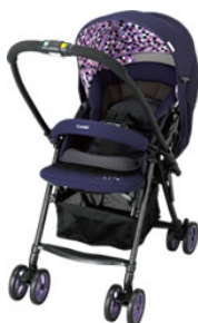
メチャカルファーストα エッグショック