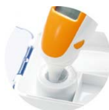
ワンタッチでプローブカバーを取り付けできる カバー装置台付き