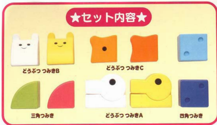
どうぶつ つみきB どうぶつ つみきC 三角つみき どうぶつ つみきA 四角つみき