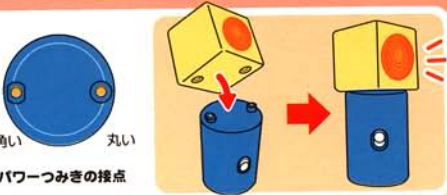
四角い 丸い パワーつみきの接点

パワーつみきを図のように接点にあわせて差し込み、スイッチをオンにしてください。接している間、光りが点滅します。接点の形が決まっており、逆入れできませんのでご注意ください。うまく差し込めない場合は接点の形を確認してからもう一度差し込んでください。